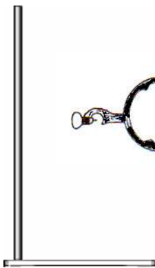
Soporte, aro, pinza y nuez