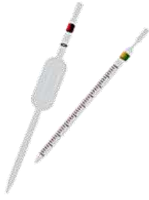
Pipeta aforada y pipeta graduada