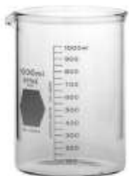
Vaso de Precipitado