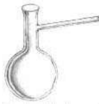
Matraz de destilación