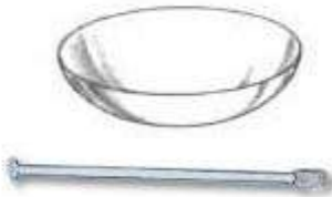
Cápsula de porcelana.