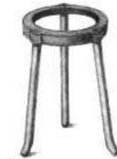
Trípode y rejilla