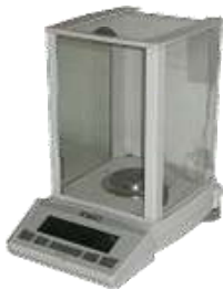
Balanza de precisión