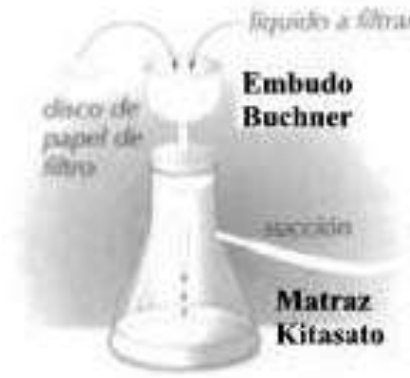
Embudo büchner y matraz kitasato