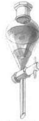
Embudo de decantación