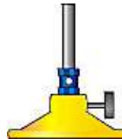
Mechero de Bunsen