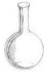
Matraz de fondo redondo