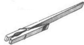
Pinza de madera